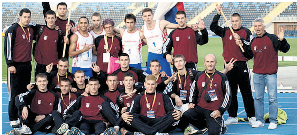
ПРЕСРЕЂНИ: Момци из Сирмијума после такмичења у Пољској

и трећепласиране Чехиње. Пресудио је број појединачних победа, Ференбахче је имао шест, ми 4, а Брно три. Наша екипа је била најмлађа, имамо мали број такмичарки које су 91. годиште, већином ће бити јуниорке и 2011. или су чак млађе јуниорке. Биле су изузетно мотивисане и недостајало нам је мало спортске среће, посебно у штафетама. Из свега се види да су пресуђивале нијансе. Сигурно бисмо се вратили с титулом да нисмо допутовали дан раније по-